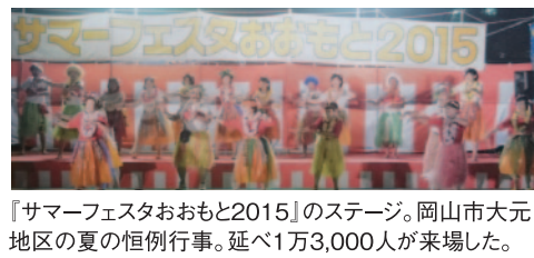
『サマーフェスタおおもと2015』のステージ。岡山市大元地区の夏の恒例行事。延べ1万3,000人が来場した。

岡山市の大元地区は、協力し合って行う行事も多いため、あえて婦人会役員と愛育委員、栄養改善委員の三役を一人の人が引き受け、8名で委員会を運営しています。 「私達、70歳を過ぎていますけど、こうして表へ出ていけるから元気なのかと思えます。みんな足や腰やあちこち痛くて、病院通いもしていますけど、こうして集まると元気が出るんですよ。」