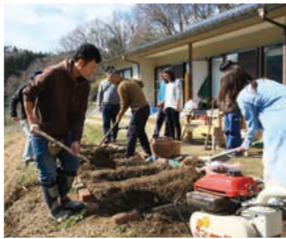
シェアハウスでの生活を体験するお試しキャンプ。家族相談会も開かれ、全国から問い合わせがある。

ちと交流するようになりましした。岡山には俯瞰的に日本を見ている面白い人材が結構多いんですよ。」 2011年には美作市の地域おこし協力隊に参加。棚田再生に取り組んだり、お年寄りの困りごとを解決したりする中で、進路に悩む若者の可能性を引き出す「人おこし」の道筋が見えてきたのです。 「僕たちがやっているのは、地域の中で役割や出番を作ること。体も動かし、博学的なのに、引きこもり」と言ったり、一気に役割をなくしてしまいます。独居高齢者にしても、元氣だし知恵があるし、世間のイメージとは全然違う。限界集落と言ったネガティブに聞こえるけれど、その地域にしかない競争力のある資源があちこちにあって豊かに暮らしているんです。」 若者は自然や人の優しさから元気をもらい、地域も若者から刺激をもらう。互いに信頼関係を築き、補い合っている活動ほど、活性化が進んでいると言います。