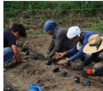
土に触れ、仲間とともに収穫の喜びを知れば、生きる力がよみがえってくる。豊かな自然の中での作業、困りごとの手伝い、地域行事への参加。村すべてが大切な活動の場だ。