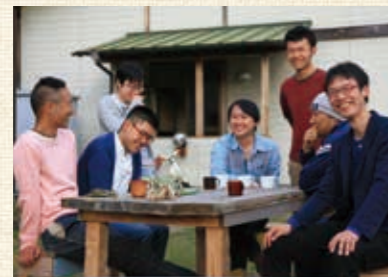
地元の人たちや外部サポーターの助けを借りながら企画・運営するNPOのメンバー。