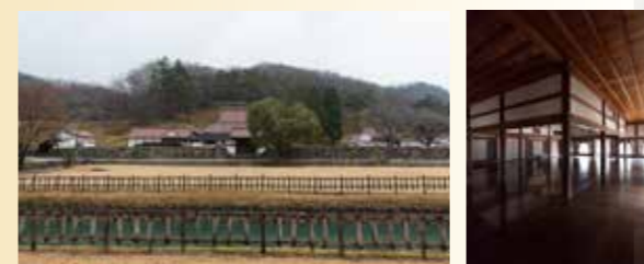
庶民のための学校だった旧閑谷学校(国宝)。講堂は今も論語の勉強会に使われている。

岡山県備前市にある旧閑谷学校は、初年度の認定ストーリー1「近世日本の教育遺産群 一学ぶ心・礼節の本源」の一つとして認定されました。このストーリーは、茨城県水戸市、栃木県足利市、岡山県備前市、大分県日田市の4つの自治体が関連するシリアル型。旧弘道館、足利学校跡、咸宜園跡と併せて、現代教育制度の礎となった藩校や郷学、私塾の歴史を知ることができます。