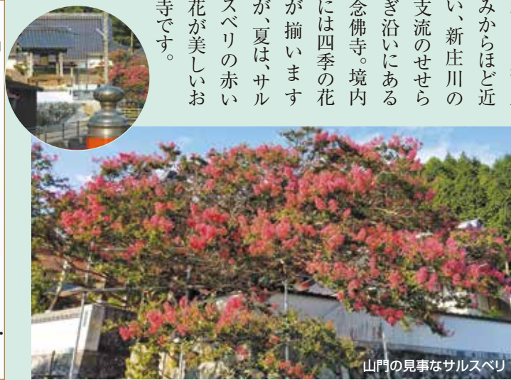
山門の見事なサルスベリ

新庄村は、今も旧出雲街道の面影が残る、美しい県北の街。本陣のあった街並みに咲く「がいせん桜」は有名ですが、夏には夏の趣があります。本陣の街並みからほど近い、新庄川の支流のせせらぎ沿いにある念佛寺。境内には四季の花が揃いますが、夏は、サルスベリの赤い花が美しいお寺です。